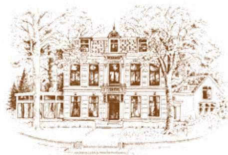
Hotel Restaurant Lunia, een monument in Oldeberkoop, Zuid-Oost Friesland, anno 2016 voorzien van eigentijdse gemakken.